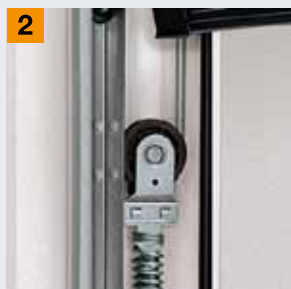
Система пружин растяжения