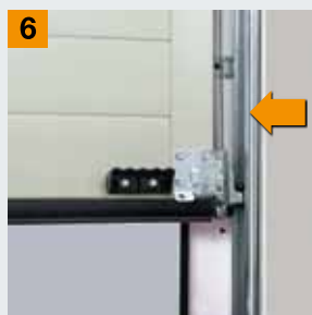
Скрытый направляющий элемент троса

Вы хотите больше безопасности? Тогда обратитесь к официальному представителю Hörmann в Вашем регионе!