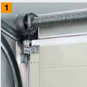
Система торсионных пружин