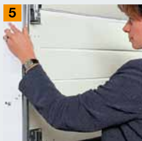
Защита от защемления пальцев в боковых направляющих