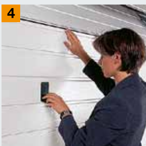
Защита от защемления пальцев